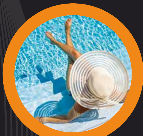
PISCINA ADULTO INFANTIL