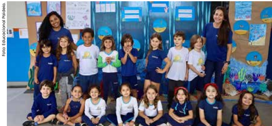
Referência em educação há 17 anos no Litoral Norte, a instituição oferece Oficina Maker, Robótica e Programa Bilingue internacional para formar os líderes do futuro.

Referência em educação no Litoral Norte, o Instituto Educacional e Cultural Paideia inicia o ano letivo de 2026 com vagas disponíveis para o primeiro semestre. Com 17 anos de tradição e duas unidades estratégicas em Caraguatatuba, que abrangem do Berçário ao Ensino Fundamental II, a instituição é a melhor opção para famílias que priorizam uma formação global, ética e que prepara os alunos para o futuro.