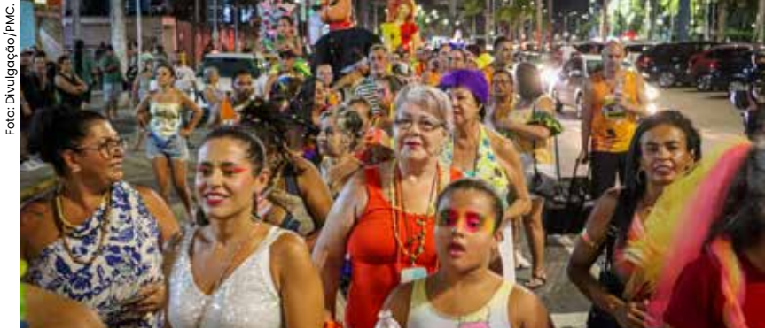
De blocos com trios elétricos a festivais de marchinhas, Caraguatatuba, Ilhabela, Ubatuba e São Sebastião confirmam as primeiras atrações para moradores e turistas.

O Litoral Norte já está em contagem regressiva para o Carnaval 2026. As cidades da região começam a divulgar suas atrações, que prometem garantir entretenimento para moradores e turistas, resgatando tradições e arrastar multidões com trios elétricos.