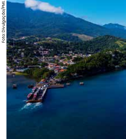
Com foco na conservação do patrimônio natural, a TPA não será cobrada de moradores de Ilhabela e São Sebastião.

A Prefeitura de Ilhabela oficializou no último dia 12 de janeiro a etapa final de implantação da Taxa de Preservação Ambiental (TPA) no município. A ordem de serviço assinada pelo prefeito Toninho Colucci autoriza o início imediato dos trabalhos por parte da empresa vencedora do processo licitatório. A partir da assinatura, a empresa tem até 10 dias para concluir a implantação do sistema, etapa que antecede o início efetivo da cobrança.