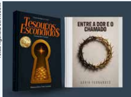
Editora inicia o ano com eventos em São Paulo (29/1) e Rio Grande do Sul (1/2), apresentando obras que abordam desde finanças infantis até a superação de limitações físicas através da fé.

A Editora GentecomBooks inicia o ano de 2026 repleta de novidades. Entre o final de janeiro e o início de fevereiro, a editora promove eventos em São Paulo (SP) e Torres (RS), destacando obras que utilizam a fé cristã como base para a educação financeira infantil e a resiliência diante da dor.