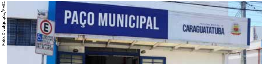
Se aprovada, a cobrança da taxa será mensal e baseada no consumo de energia de cada imóvel.

Para manter-se em conformidade com o Novo Marco Legal do Saneamento Básico (Lei Federal nº 14.026/2020) e com a Política Nacional de Resíduos Sólidos (Lei nº 12.305/2010), o Governo Municipal de Caraguatatuba protocolou na Câmara de Vereadores o Projeto de Lei que cria a Taxa de Manejo de Resíduos Sólidos Urbanos (TMRSU).