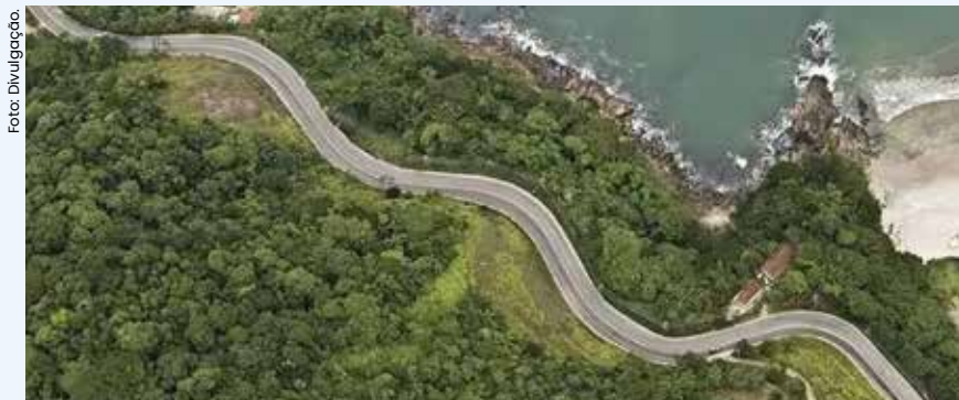
Obras de duplicação, rotatórias e definições de prazo e cronograma estão entre os pontos prioritários da reunião.