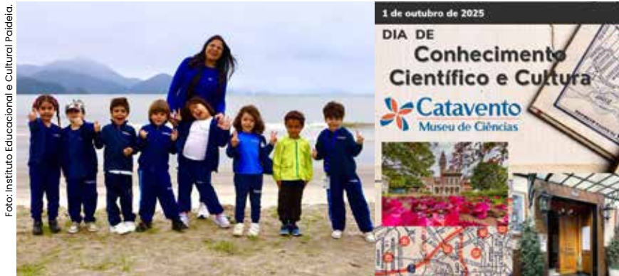
Um complemento aos estudos em sala de aula, a excursão ao museu de ciência e tecnologia é uma oportunidade para que os alunos aprendam de maneira interativa.

Visando enriquecer ainda mais os estudos realizados em sala de aula, o Instituto Educacional e Cultural Paideia promove uma visita de campo ao Museu Catavento, em São Paulo, no início do mês de outubro para alunos do Pré-2 e Ensino Fundamental.