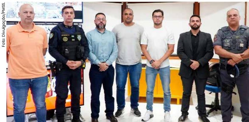
O programa visa fortalecer o trabalho já realizado pelo Centro de Operações Integradas, aumentando a eficácia das ações policiais em tempo real no município.

Mantendo como prioridade a segurança pública, a Prefeitura de São Sebastião deu mais um passo importante para ampliação do combate à criminalidade. Seguindo o planejamento estratégico, a gestão está avançando com as negociações para a implantação de câmeras inteligentes de reconhecimento facial em pontos estratégicos da cidade.