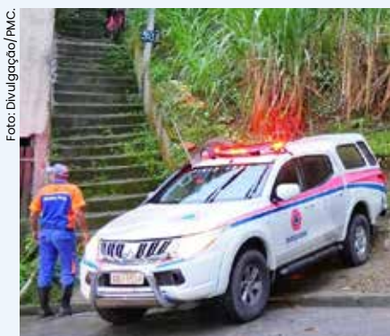
As audiências públicas acontecem nos dias 02, 09 e 23 de outubro.

A Secretaria de Segurança Pública e Mobilidade Urbana e Defesa Civil promove nos dias 02, 09 e 23 de outubro, nos bairros Jaraguazinho, Morro do Algodão e Casa Branca, respectivamente, Audiências Públicas do Plancon - Plano de Contingência da Defesa Civil. As reuniões foram agendadas nos bairros de maior risco de deslizamentos (Jaraguazinho e Casa Branca) e alagamentos (Morro do Algodão).