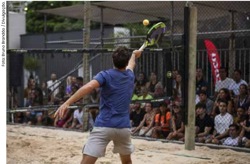
Com expectativa de reunir cerca de 300 atletas de 18 países, a competição ocorre na Arena Nacional do Serramar Shopping e tem entrada gratuita.

Caraguatatuba será palco de um dos maiores eventos esportivos do continente. Entre os dias 25 e 28 de setembro, a cidade recebe o Campeonato Pan-ame-