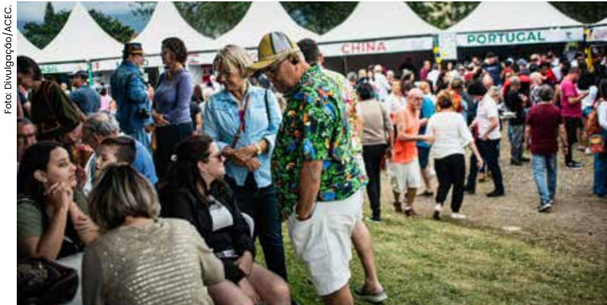
A tradicional celebração solidária contará com 17 entidades representando a gastronomia de 13 países, com toda a renda revertida para a causa social.

Neste fim de semana, de 26 a 28/9, Caraguatubá será palco da tradicional Festa das Nações. A 3ª edição do evento tem entrada gratuita e será realizada na Praça da Cultura, no Centro. Organizada pela Associação Comercial e Empresarial de Caraguatubá (ACEC), a festa reúne gastronomia, cultura e solidariedade.