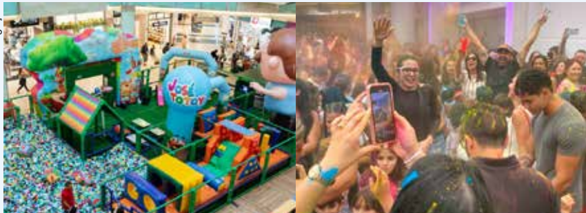
Shopping em Caraguatubá traz atrações pagas e gratuitas para crianças e famílias durante todo o mês de outubro.

O Serramar Shopping preparou um mês inteiro de lazer e diversão para celebrar o Dia das Crianças, com duas grandes atrações: o Parque José Totoy, na Praça de Eventos, e o projeto “Outubro Encantado”, no Deck Magalu.