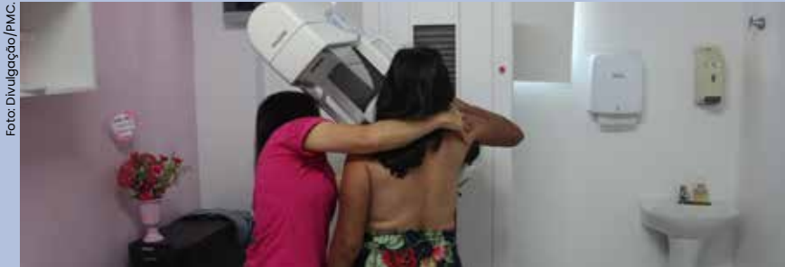
Campanha municipal inclui dois sábados de mutirão para diagnóstico precoce e evento de capacitação para a Rede de Saúde com especialistas, ginecologistas e psicólogos.

Em alusão ao mês dedicado à prevenção e ao diagnóstico precoce do câncer de mama, Outubro Rosa, Caraguatatuba fechou o cronograma que inclui a realização de exames e capacitação de profissionais.