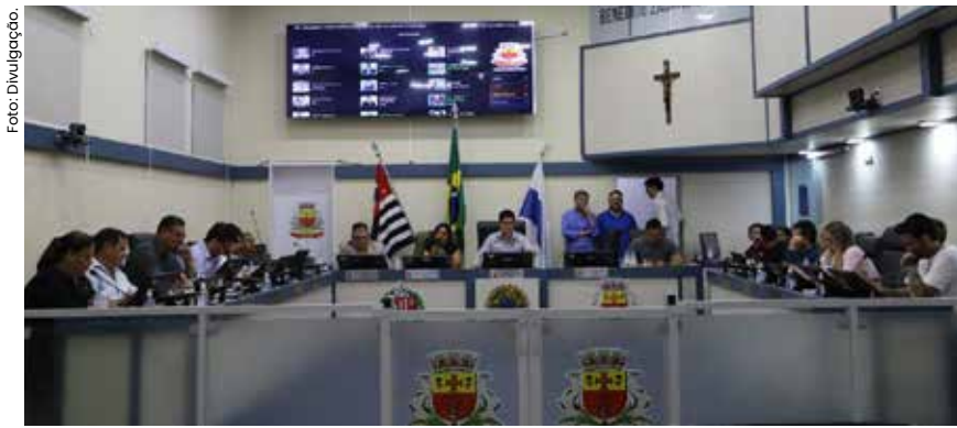
Com a aprovação da LDO e do PPA, os projetos de lei seguem para a próxima etapa: a Lei Orçamentária Anual (LOA) de 2026 será enviada para votação até 31 de outubro.

Os projetos de lei da elaboração da Lei de Diretrizes Orçamentárias (LDO) de 2026 e do Plano Plurianual (PPA) 2026–2029 de Caraguatatuba foram aprovados por unanimidade na sessão ordinária da última terça-feira (30/9), na Câmara Municipal, no Centro.