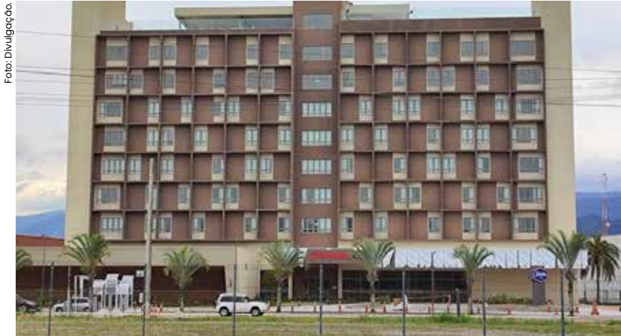
Empreendimento com 175 quartos, piscina e rooftop com vista para a Serra do Mar marca nova fase para o turismo de negócios e lazer no Litoral Norte.

Caraguatatuba avança para uma nova fase turística com a abertura oficial do hotel Hampton by Hilton, no Complexo Turístico do Serramar Shopping, neste mês de outubro. Uma das obras mais aguardadas na região, o empreendimento promete novos ares para o turismo de negócios e lazer no Litoral Norte.