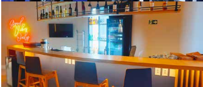
Ministro de Portos e Aeroportos oficializa início do projeto, que cria um corredor multimodal no Litoral Norte junto à inauguração do Hotel Hampton by Hilton.

Durante uma visita recente, o ministro de Portos e Aeroportos, Silvio Costa Filho, confirmou oficialmente o início das obras do aeródromo em Caraguatutuba. O investimento, cerca de R$ 100 milhões, integralmente vindo da iniciativa privada, marca o começo de uma nova fase para a economia local. O projeto promete não apenas encurtar distâncias, mas também ampliar oportunidades de negócios e fortalecer a logística de todo o Litoral Norte.