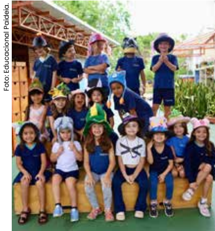
Com abordagem humanista e ensino bilíngue internacional, o Paideia é referência de ensino no Litoral Norte.

Destacando-se no ramo educacional por sua abordagem humanista e resultados acadêmicos excepcionais, o Instituto Educacional e Cultural Paideia promoveu um momento inesquecível para pais e alunos com a mostra de arte 'Seres Vivos e seus Encantos: na terra, no ar e na água', onde exibiu trabalhos temáticos desenvolvidos em sala de aula por estudantes do Berçário e do Fundamental I.