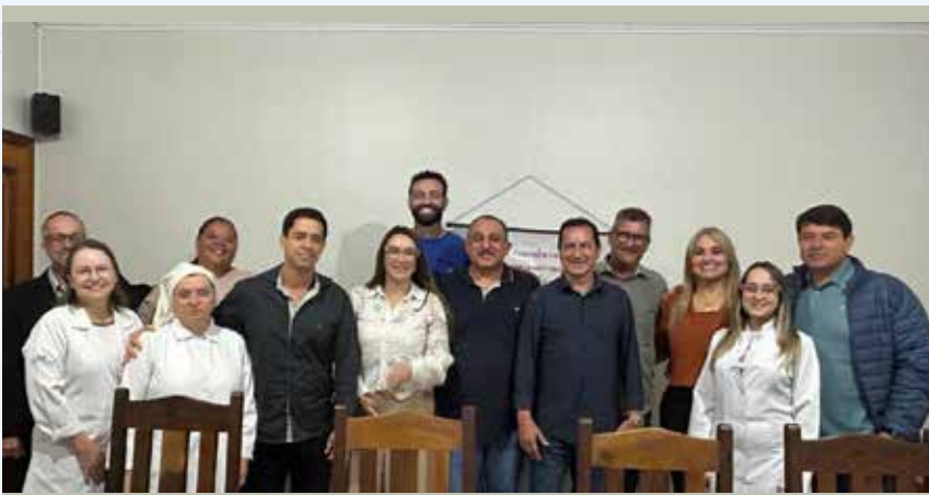
Na reunião foi discutido o aprimoramento do atendimento e a busca por soluções conjuntas para garantir saúde pública mais ágil e humanizada no município.